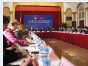
Délégation du voyage en Chine en 2009

Revenons ici sur l'ensemble de ce programme qui a permis de mieux comprendre les enjeux de la Chine d'aujourd'hui et son évolution.