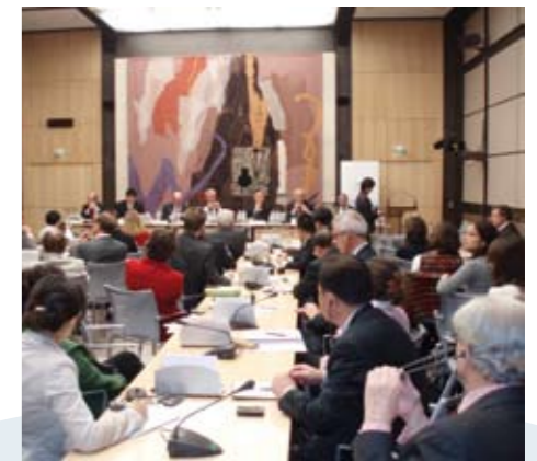
Colloque du 3 novembre 2009 à l'Assemblée nationale

Même si les relations politiques franco-chinoises ont connu récemment quelques soubresauts, les fondamentaux sont intacts. Il ne faut jamais oublier le sentiment de proximité spontanée qui existe depuis toujours entre les Chinois et les Français et trouver sur cette base de nouvelles pistes de coopération. FDS a bien l'intention de poursuivre cette réflexion commune et de contribuer à tisser des liens pérennes entre les deux pays.