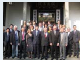
Délégation du voyage en Chine en 2010