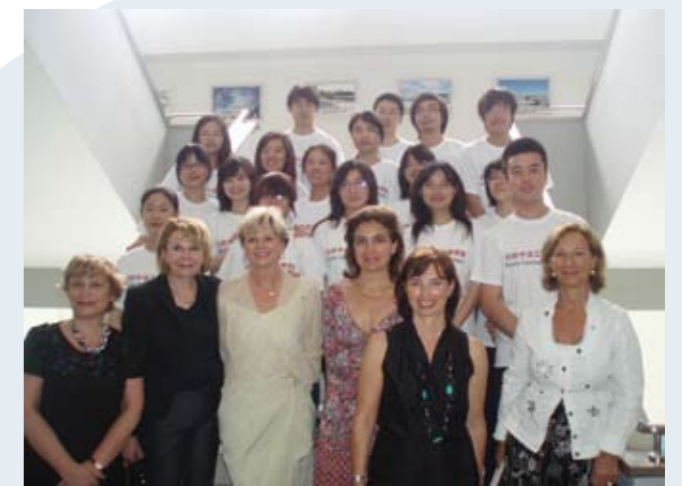
Délégation FDS lors du voyage en 2010

Consultez les carnets de voyages et les synthèses des conférences organisées dans le cadre du programme sur www.femmes-debat-societe.com